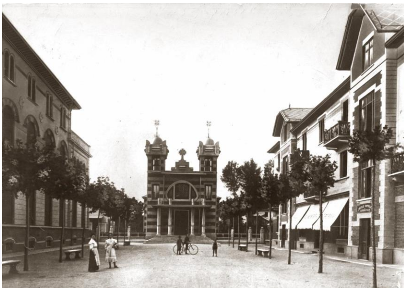
Villaggio Leumann, Chiesa di Santa Elisabetta.

Non era sostenibilità. Non esisteva il termine. Era una scelta industriale. Un modo diverso e più intelligente di fare impresa.