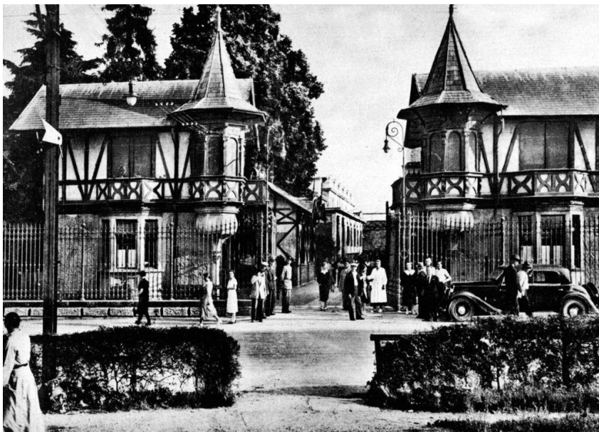
Villaggio Leumann, Ingresso del cotonificio.

Alla fine dell'Ottocento, a pochi chilometri da Torino, nasce il Villaggio Leumann .